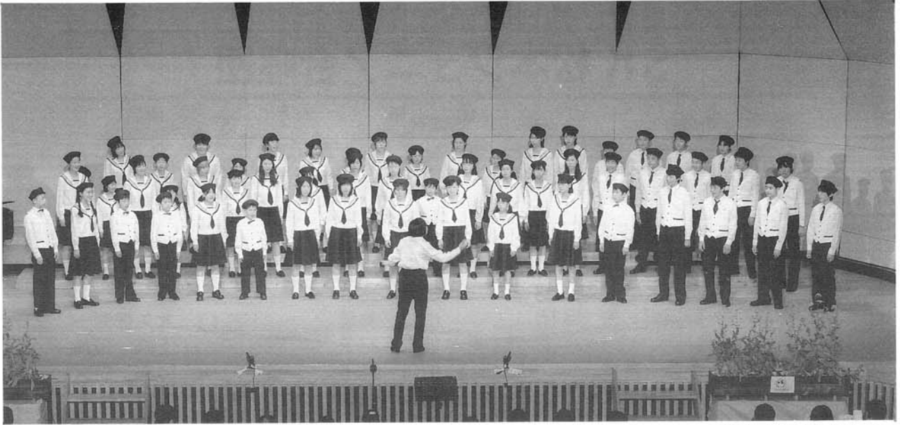
長野県少年少女合唱祭